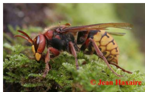
Frelon commun : Vespa crabro

Vespa crabro , lui a le corps taché de roux, de noir et de jaune et l'abdomen est jaune rayé de noir. Vespa crabro est le seul frelon présent en Europe.