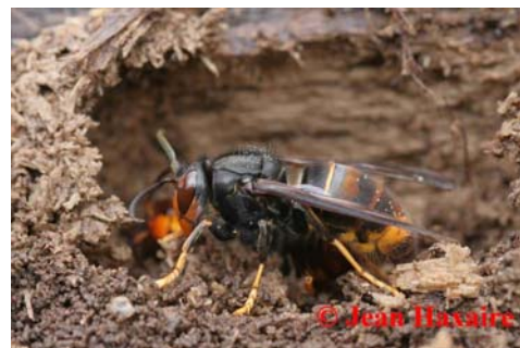
Frelon asiatique : Vespa velutina sous espèce nigrithorax

L'adulte mesure jusqu'à 30 mm de long (contre 50 mm maximum pour le frelon commun, Vespa crabro ), le thorax est entièrement brun noir velouté, l'abdomen présente des segments bruns bordés d'une bande orangée. La séparation des deux derniers segments abdominaux est entièrement jaune orangée.