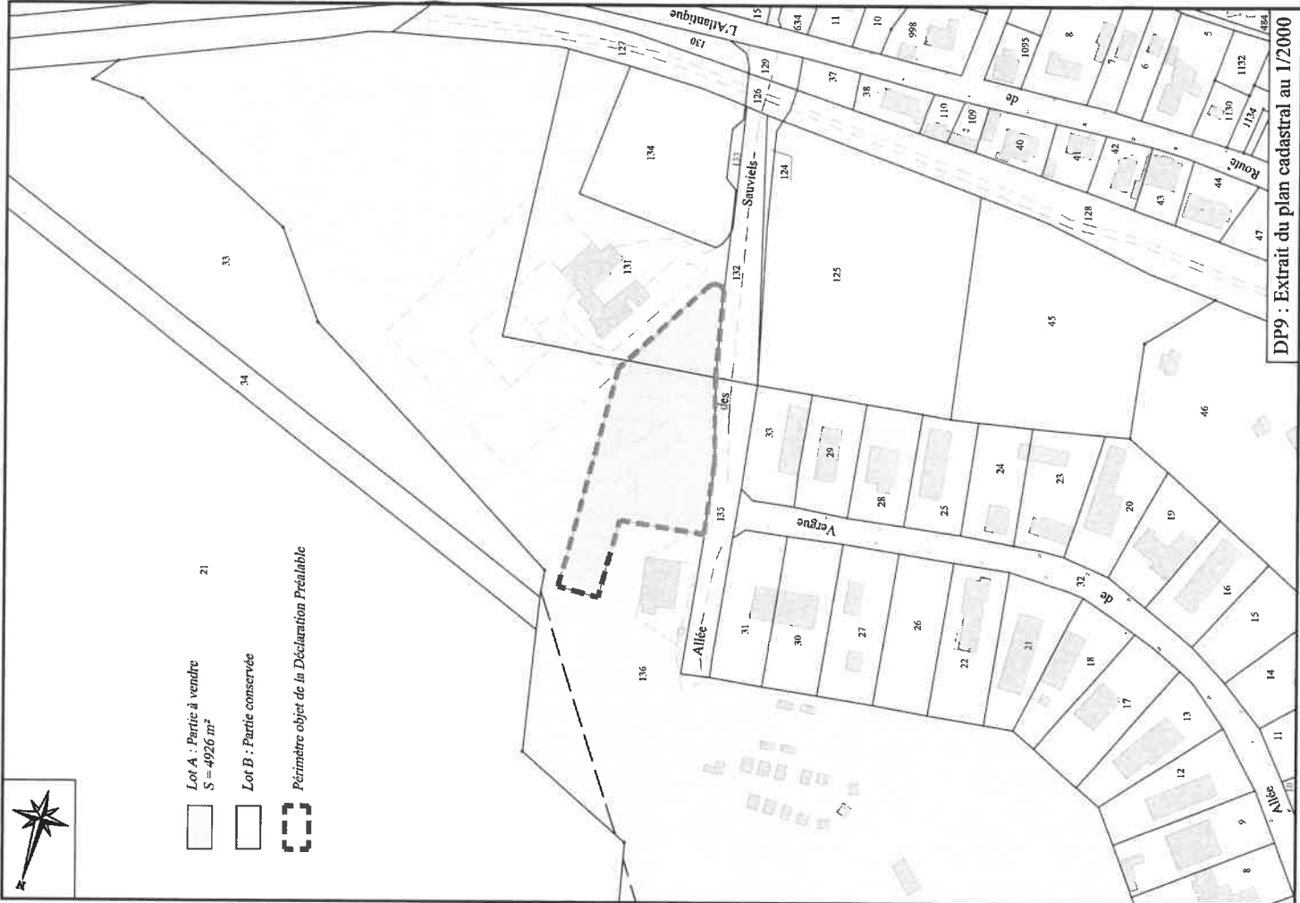
DP9 : Extrait du plan cadastral au 1/2000

Accusé de réception en préfecture 033-213302144-20200721- DL16072020-04-DE Date de réception préfecture : 21/07/2020