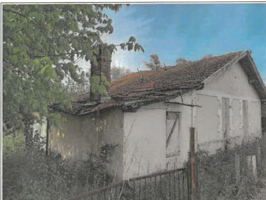
Photo n°8: Fichier : 20210430_092039.jpg Remonté le : 30/04/2021 10:21