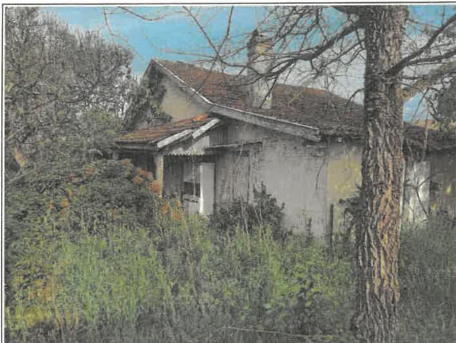
Photo n°7: Fichier : 20210430_092013.jpg Remonté le : 30/04/2021 10:21