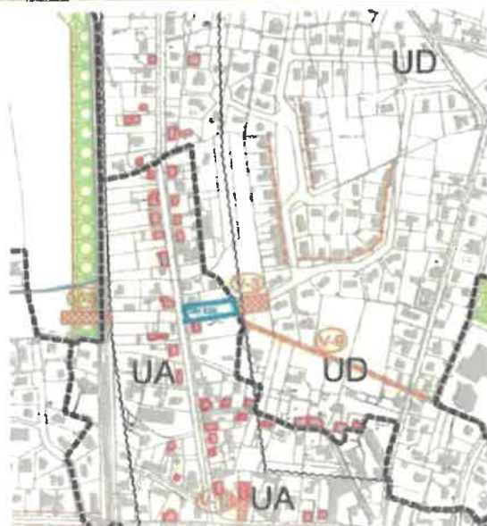
Extrait du plan de zonage UA où se trouve la parcelle DH 118