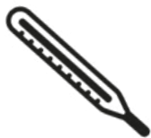
Fièvre > 38°C